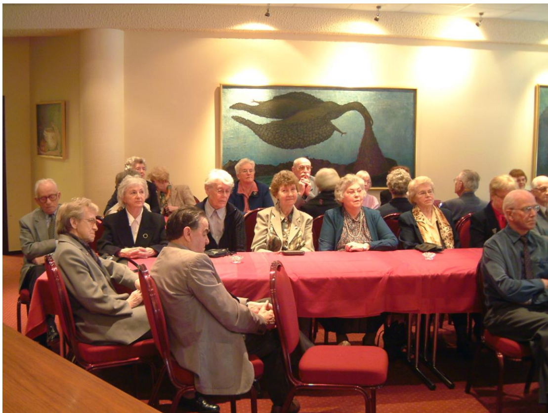
Fyrsti fundur FKE á Akureyri laugardaginn 15. maí 2004