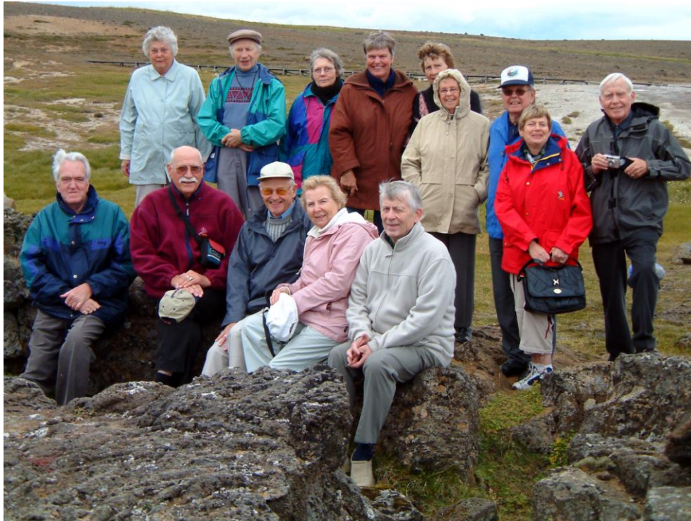
Fyrsta sumarferðin frá Akureyri var farin til Hveravalla 25. ágúst 2004. Hér er hópurinn í svonefndri Eyvindartóft.